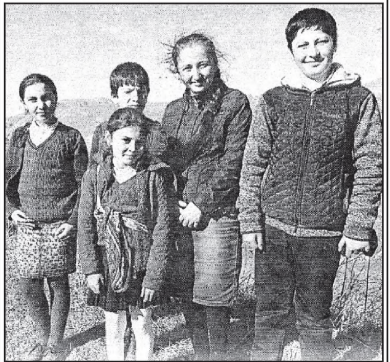
Суратрай: Дарсирая нанисса Хььюйннал шьраваллил оьрчру.

Муххай рахьму къабул-лай, жула оьрчлай рахьму буллалияра!