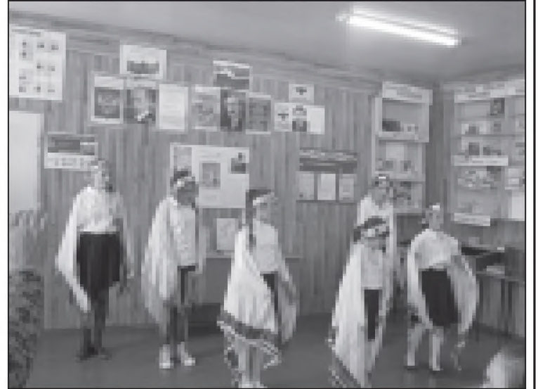
Суратрай: Байрандалун хас дурсса инсценировка.

Виричунан чу ххирар, Багьманчинан Багь ххирар, Вингу Дагъусттан ххирар, Жавгьар кунма пар тли бан.