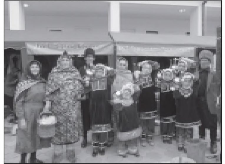
Суратрай: Чїайннал коллектив «Авадан»

сатнал ва Дагьусттаннал ттугьру бившуну.Лайкьессия вайгу, буну тїий Сутїаевхьал кулпат Аьрасатнал ва Дагьусттаннал аьрцарайх пив хьуну цала пагьмурдан лархьхьусса давурттивгу дуллай цала кулпатиртташчал яхьанай буну тїий. Ибрагїнхалиллул ва Патїматлул