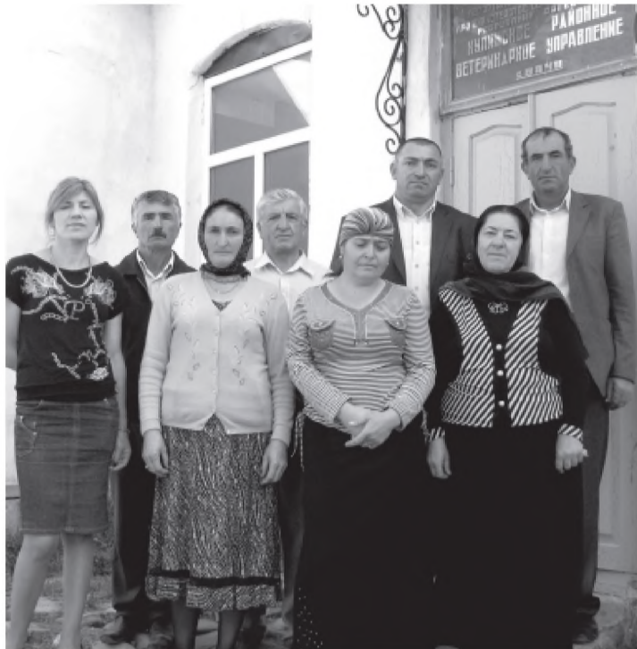
Шура - Вихляева м.ц.

Мукунна хьунмасса зарал биян буллаи бивкиссар яттийн, ризкбилин паразитирдал азардал, махьсса шиннардий бувккун бур паразитирдайн кярщисса ххуйсса даруртту ва миннуя хлайван бивчлаву духлаган