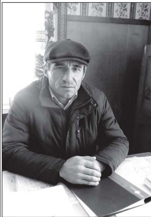
Сураграй: Шамхалов Серегин

Ильичлул лампочкалул чани зунттавусса жула районнайн бувкIессар 1960-ку шиннардий. Барчаллагь хIукуматран чIалну бучIарчагу